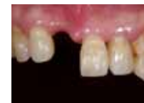
ダイレクトブリッジ