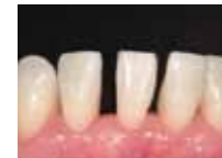
離開歯列への修復