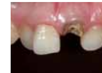
ダイレクトクラウン修復